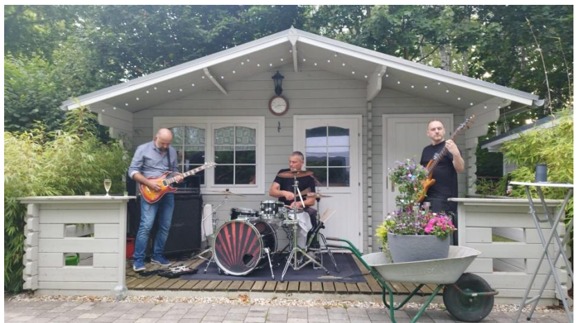
„Groschen“ - Hier bebt die Hütte.

Angefangen hat die Band während der Covid Jahre als Drum & Bass Duo . Der Bandname Groschen verbindet die Familiennamen Schorlemmer und Grosse, sagt aber hoffentlich nichts über den Wert der Band aus. Mittlerweile sind wir ein Trio, also manchmal auch die Dreigroschenopa. 😊