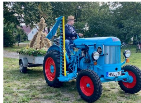
Die Erntekrone kam zuletzt mit dem Trekker.

Am Vortag zum Erntedanksonntag wird es vor der Kirche auf der Festwiese in Kooperation mit dem Heimatverein e.V. ein Erntefest geben. (Bitte Aushänge beachten!) Dabei sind Ihre Erntegaben ein wichtiger Beitrag an diesem Tag! Wir bitten herzlich, zum Schmuck der Kirche um Früchte, Obst, Gemüse, herbstliches Dekor aus Garten und Wald oder auch selbstgekaufte Lebensmittel bis 15:30 zur Kirche zu bringen. (mb)